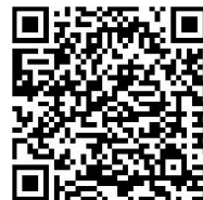
Trainingszeiten TTSG Vallendar/Urbar